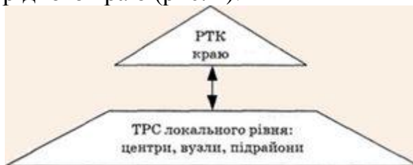
Рис. 1. Основні об'єкти туристичного краєзнавства

Отже, основним об'єктом туристичного краєзнавства виступає, у широкому розумінні, рекреаційно-туристичний потенціал території, а у вузькодисциплінарному вимірі - рекреаційно-туристичний комплекс (РТК) рідного краю (рис. 1).