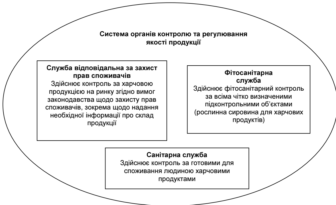
Рис. 1. Розподіл повноважень щодо організації контролю в межах системи декількох відомств