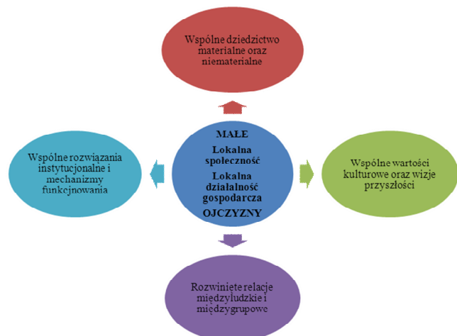
Schemat 1. Społeczna, oparta na lokalizmie koncepcja małej ojczyzny

Lokalizm jest koncepcją polityczną oraz socjologiczną, zgodnie z którą społeczności lokalne oraz towarzysząca im działalność gospodarcza jest czymś więcej, niż jedną z form zaspokajania potrzeb oraz zorganizowania życia społecznego. Jest traktowana jako współczesna, złożona forma łączenia ludzi, kreacji nowych relacji oraz pożądaných i akceptowanych przez mieszkańców wartości. Małe ojczyzny mają swoje wizje przyszłości oraz wspólne wartości kulturowe, swoje materialne i niematerialne dziedzictwo (schemat 1). Na dziedzictwo materialne składają się zarówno obiekty materialne, jak zachowana sieć komunikacyjna, zabytki kultury, dzieła sztuki, budynki i budowle, miejsca prowadzenia działalności gospodarczej, jak i zmienione przez człowieka ekosystemy tworzące łącznie krajobrazy. Dziedzictwo niematerialne łączy się przede wszystkim z zachowanymi i pielęgnowanymi tradycjami, zwyczajami, opowieściami i legendami, ale również z wymiarem estetycznym czy poznawczym ekosystemów przyrodniczych oraz istniejących krajobrazów.