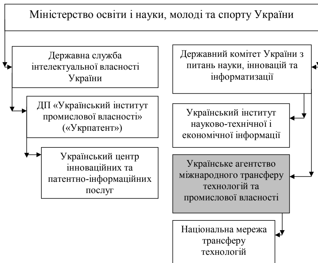
Рис. 3. Удосконалення організаційної структури органів державного управління міжнародним трансфером промислової власності в Україні.

Структура органів управління міжнародним трансфером промислової власності та включення до неї запропонованого у дисертаційному дослідженні Українського агентства міжнародного трансферу технологій та промислової власності представлено на рис.3.: