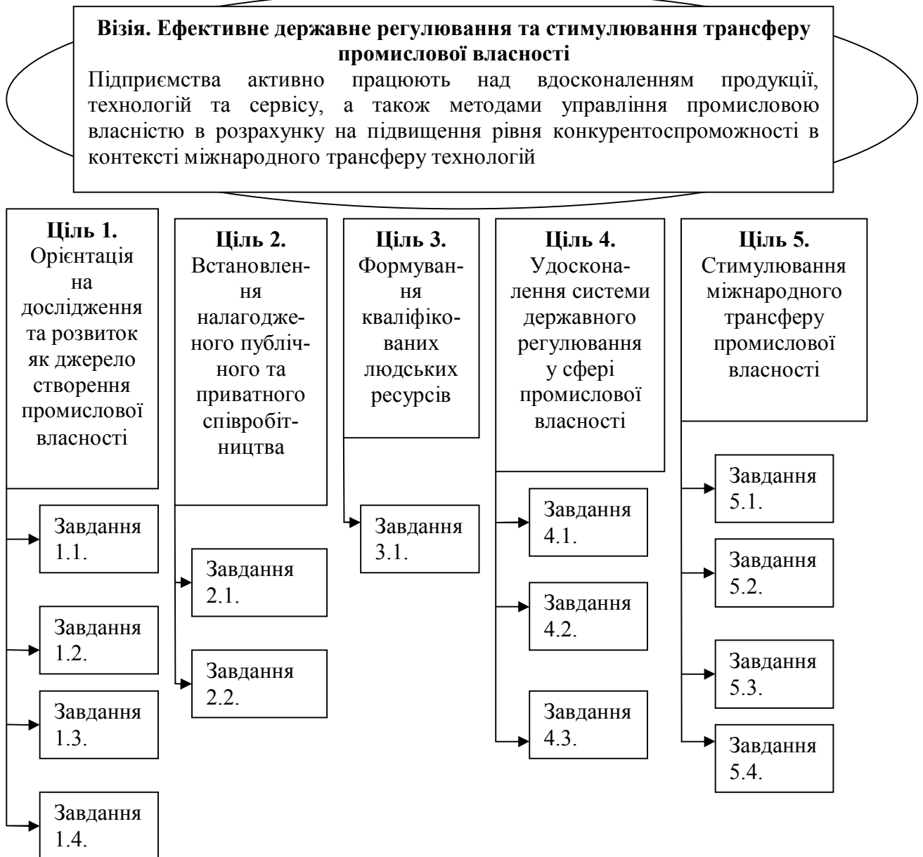
Рис. 1. Модель державного регулювання та стимулювання трансферу промислової власності в Україні

У третьому розділі «Організаційно-управлінські аспекти удосконалення державного регулювання міжнародного трансферу промислової власності» розроблено модель державного регулювання та стимулювання трансферу промислової власності, сформовано ряд рекомендацій щодо удосконалення державного управління міжнародним трансфером промислової власності в Україні. Модель державного регулювання та стимулювання трансферу промислової власності представлено на рис. 1.