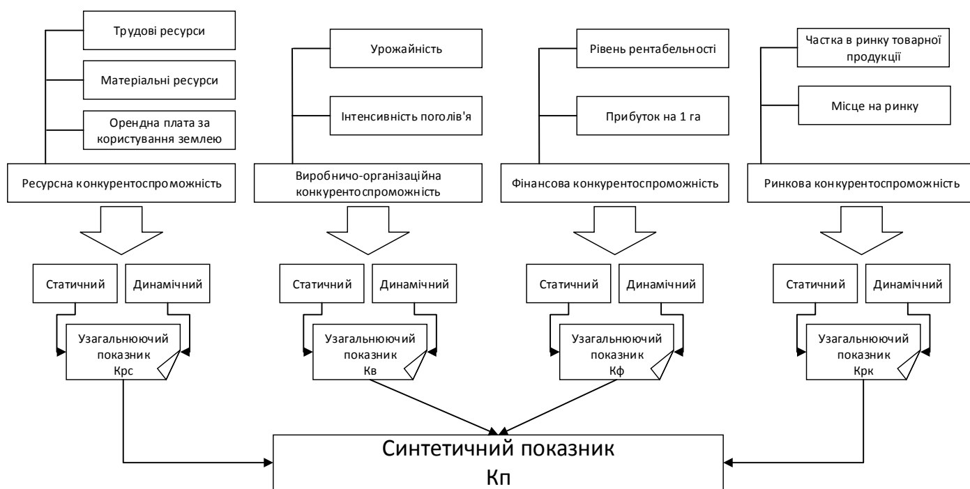
Рис. 2. Розрахунок інтегрального показника конкурентоспроможності сільськогосподарських підприємств

Аналіз часткових результатів діяльності сільськогосподарських підприємств не дає змоги оцінити загальний стан їхньої конкурентоспроможності. Для такої оцінки запропоновано розраховувати інтегральний показник (рис. 2). Його визначення передбачає застосування багатовимірної комплексної оцінки, яка дасть змогу встановити місце підприємства серед інших суб'єктів галузі за сукупністю показників.