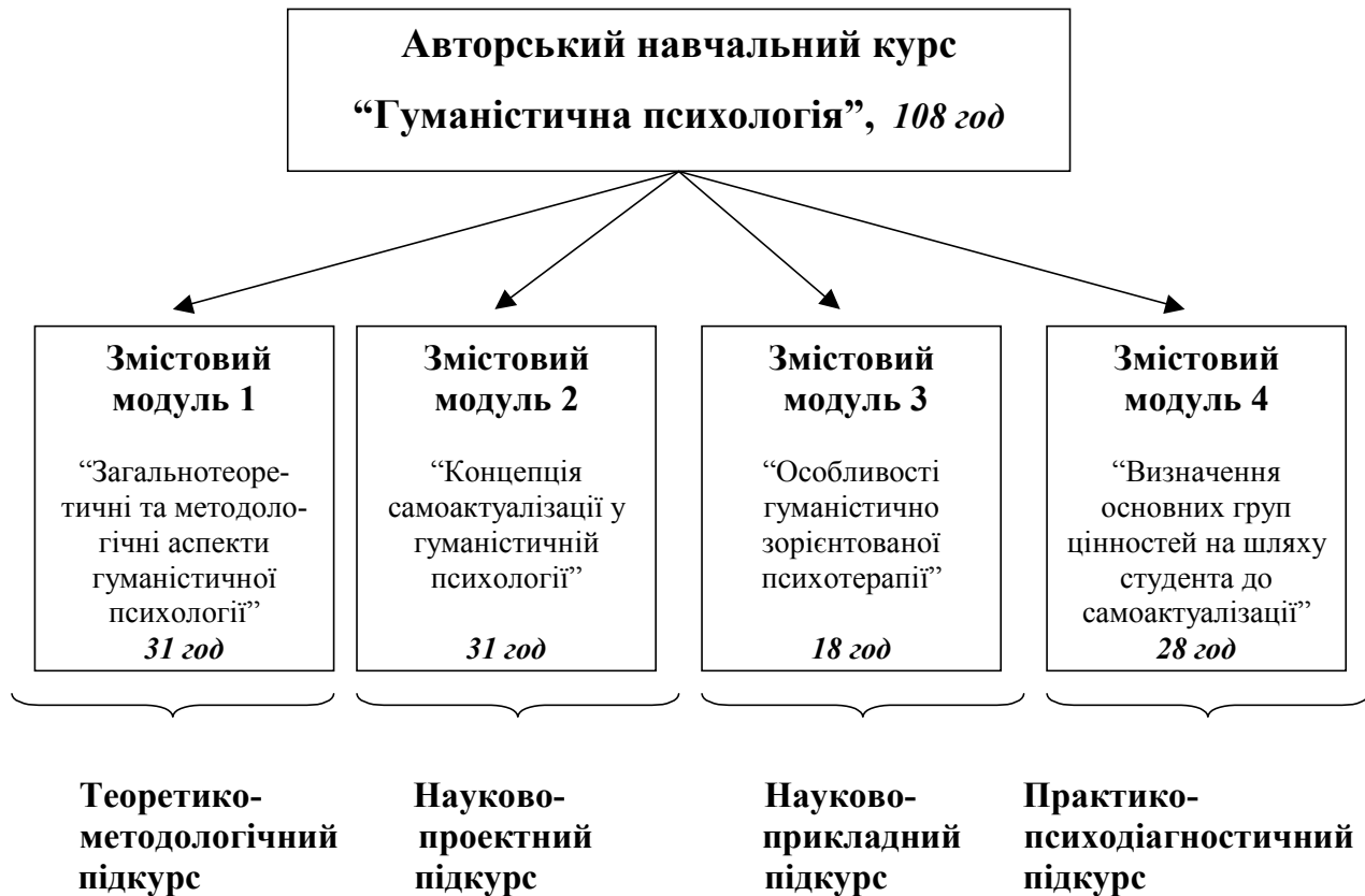
Рис. 1. Модульно-змістова структура авторського курсу

Крім того, нами розроблена та апробована граф-схема навчального курсу “Гуманістична психологія”, що дає змогу долати традиційний дисбаланс між освітньо-академічними і буттєво-особистісними інтересами студентів, залучати їх до наукового проектування і психодіагностичного практикування (рис. 2). Граф-схема побудована на основі авторських концептуальних положень (див. Фурман А.В. Модульно-розвивальне навчання: принципи, умови, забезпечення: Монографія. – К.: Правда Ярославичів, 1997. – 340 с.), а саме: