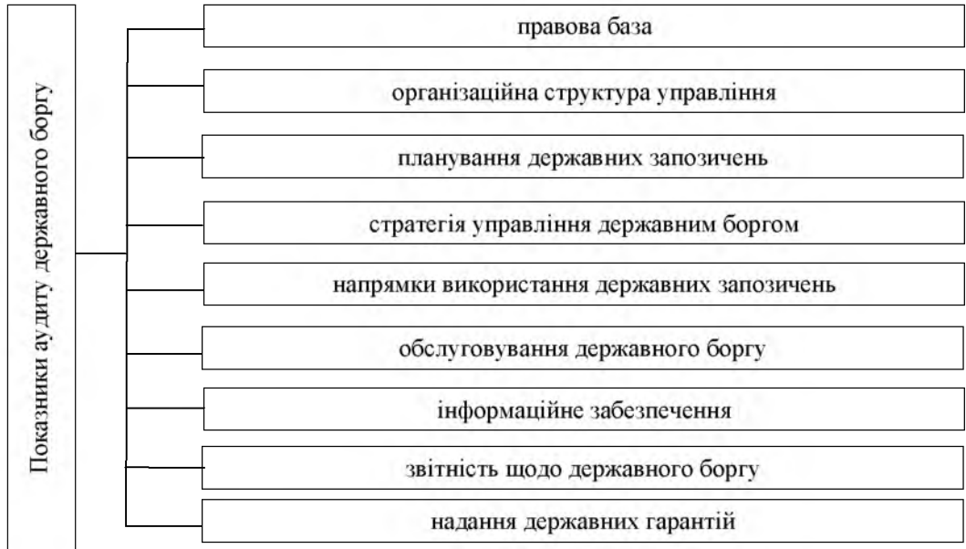
Рис. 1. Показники аудиту ефективності управління державним боргом*