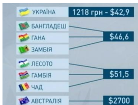
Рис. 2. Порівняння мінімальної зарплати в Україні з іншими країнами станом на 26.02.2015 року (період найнижчого рівня офіційного курсу гривні до американського доллара)

Як видно з рис. 2 у період анти рекорду 1218 гривень – це менше 43 доларів. Навіть у жебраків Бангладеш, Гані та Замбії отримують на 4 долари більше. Значно багатші жителі Лесото, Гамбії і Чаду. Там "мінімалка" досягає 51 долара. Для порівняння, найвища мінімальна зарплата у світі – в Австралії. Там робітник отримує не менше 2700 доларів. Нагадаємо, наступне підвищення "мінімалки" в Україні відбудеться не раніше грудня 2015-го.