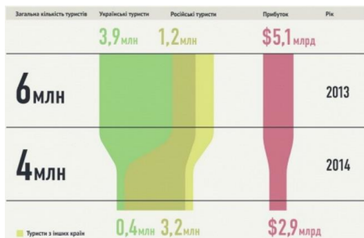
Рис. 1. Структура туристичних потоків АР Крим в 2014 році [4].

Суттєвий вплив на глобальну конкурентоспроможність туристичної індустрії України має анексія АР Крим. Оскільки це не лише зменшило число відпочиваючих на цій території, а й «відрізуло» вагому туристичну зону національної туристичної індустрії. Варто зазначити також, що анексія території АР Крим перерозподілила значною мірою внутрішні туристичні потоки та дещо активізувала розвиток туризму в інших регіонах. Зріст розміру сплати податків і зборів спостерігається у Вінницькій, Волинській, Дніпропетровській, Житомирській, Івано-Франківській, Київській, Миколаївській, Одеській, Полтавській, Рівненській, Сумській та Чернівецькій областях [3].