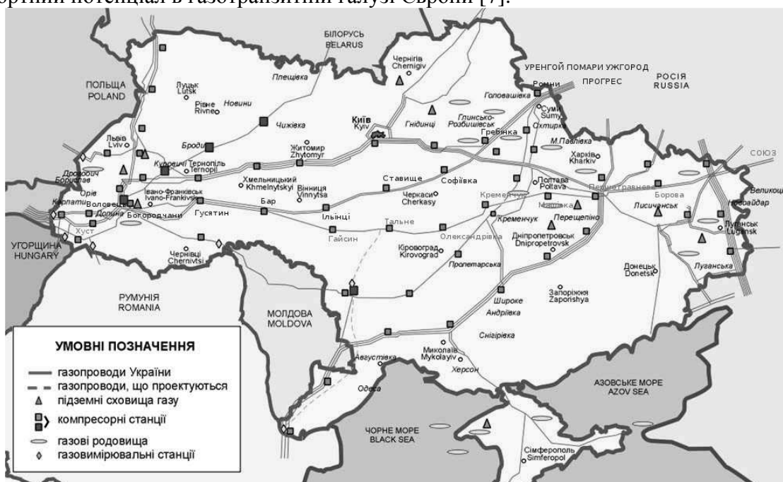
Рис. 3. Магістральні газопроводи України.

Як відомо, для України важливою сировиною для перевезень є нафта і газ. Україна у 2013 р. збільшила транзит газу до Європи – до 86,1 млрд куб. м., що на 1,9 млрд куб. м. або на 3,2% більше показників аналогічного періоду минулого року (див. рис. 3). Відповідно до цього, у 2013 р. „Укртрансгаз” своєчасно і в повному обсязі виконав всі заявки з транспортування природного газу європейським і українським споживачам. Крім цього, всього за січень-грудень звітного року, ВАТ „Укртрансгаз” експортував 130 млрд. куб. м. природного газу, що лише на 2,6 % або 3,4 млрд. куб. м. менше показників попереднього року. Нагадаємо, за оперативними даними центрального диспетчерського департаменту ВАТ „Укртрансгаз”, з початку 2013 р. Україна скоротила обсяги надходження імпортованого газу з Російської Федерації на 4,9 млрд. куб. м або на 15,1 %. Відповідно до цього можна стверджувати, що країни хоче відновити свій транспортний потенціал в газотранзитній галузі Європи [7].