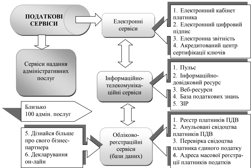
Рис. 1. Класифікація видів податкового сервісу

Як бачимо з рис. 1, поділ податкових сервісів за категоріями на електронні, інформаційно-телекомунікаційні, обліково-реєстраційні та сервіси надання адміністративних послуг, з одного боку, дозволяє чітко їх класифікувати за напрямками використання та безпосереднім призначенням, а з іншого – є досить умовний, оскільки між усіма видами податкових сервісів існує тісний взаємозв'язок, або переплетення функцій шляхом їх взаємодоповнення. Наприклад, інформаційно-телекому-