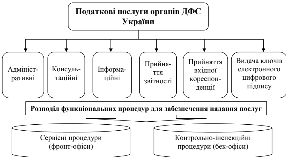
Рис. 2. Перелік послуг, які надають платникам органи ДФС України, та процедури їх забезпечення*

Крім цього, електронні сервіси тісно взаємопов'язані з системою надання ад-