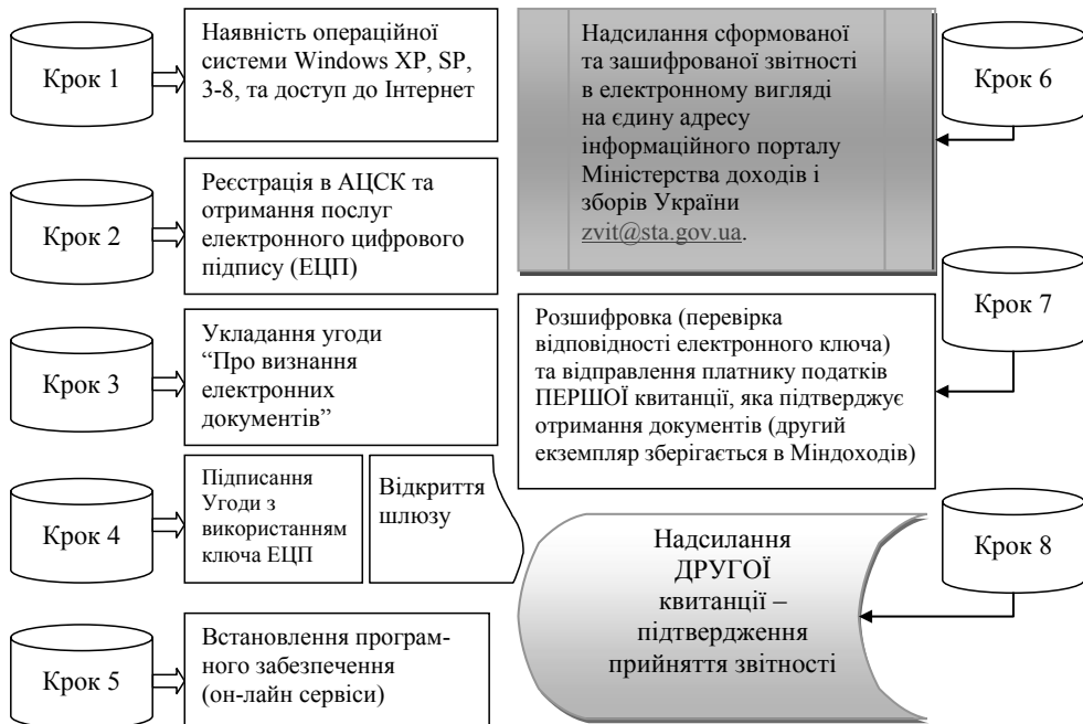
Рис. 4. Технологія формування та подання податкової звітності в електронному вигляді [4].

Для її реалізації в податкових органах відкрито Акредитований центр сертифікації ключів Інформаційно-довідкового департаменту (АЦСК ІДД) Міндоходів, який надає послуги електронного цифрового підпису органам державної влади, органам місцевого самоврядування, підприємствам, установам та організаціям всіх форм влас-