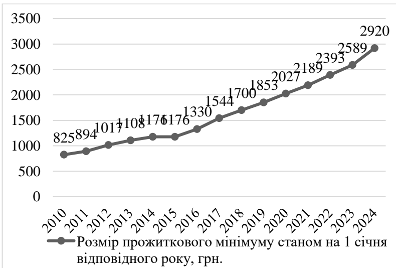
Рис. 2. Динаміка розміру прожиткового мінімуму в Україні впродовж 2010-2024 рр., грн.*