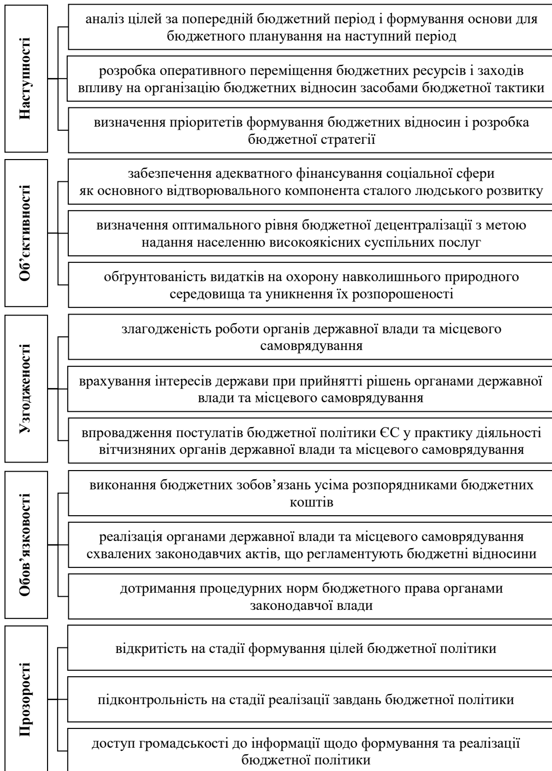
Рис. 2. Принципи, що сприяють формуванню дієвої бюджетної політики держави

Обґрунтовано концептуальні підходи до модернізації структури Основних напрямів бюджетної політики та визначено її елементи. До останніх віднесено: аналіз системи цілей бюджетної політики за попередній бюджетний період та результатів їхнього досягнення; постановку цілей і тактичних завдань на наступний бюджетний період з обов'язковим збалансуванням соціальної, економічної та екологічної складових розвитку держави; постановку цілей і