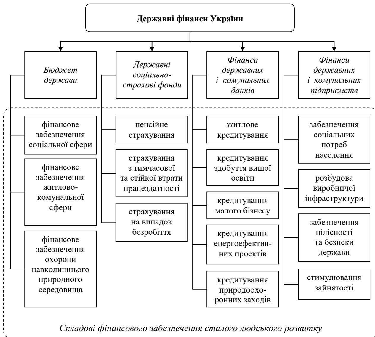
Рис. 1. Соціоцентрична структура державних фінансів України

На основі теоретичного аналізу та узагальнення підходів до поняття сталого людського розвитку сформульовано авторське трактування його сутності як процесу, що забезпечує усім членам суспільства однакові фінансові можливості щодо зміцнення здоров'я, удосконалення професійної компетентності, екологічних умов життя; допомоги незахищеним прошаркам населення шляхом справедливого перерозподілу ресурсів; формування соціальної відповідальності перед майбутніми поколіннями за допомогою фінансового потенціалу держави.