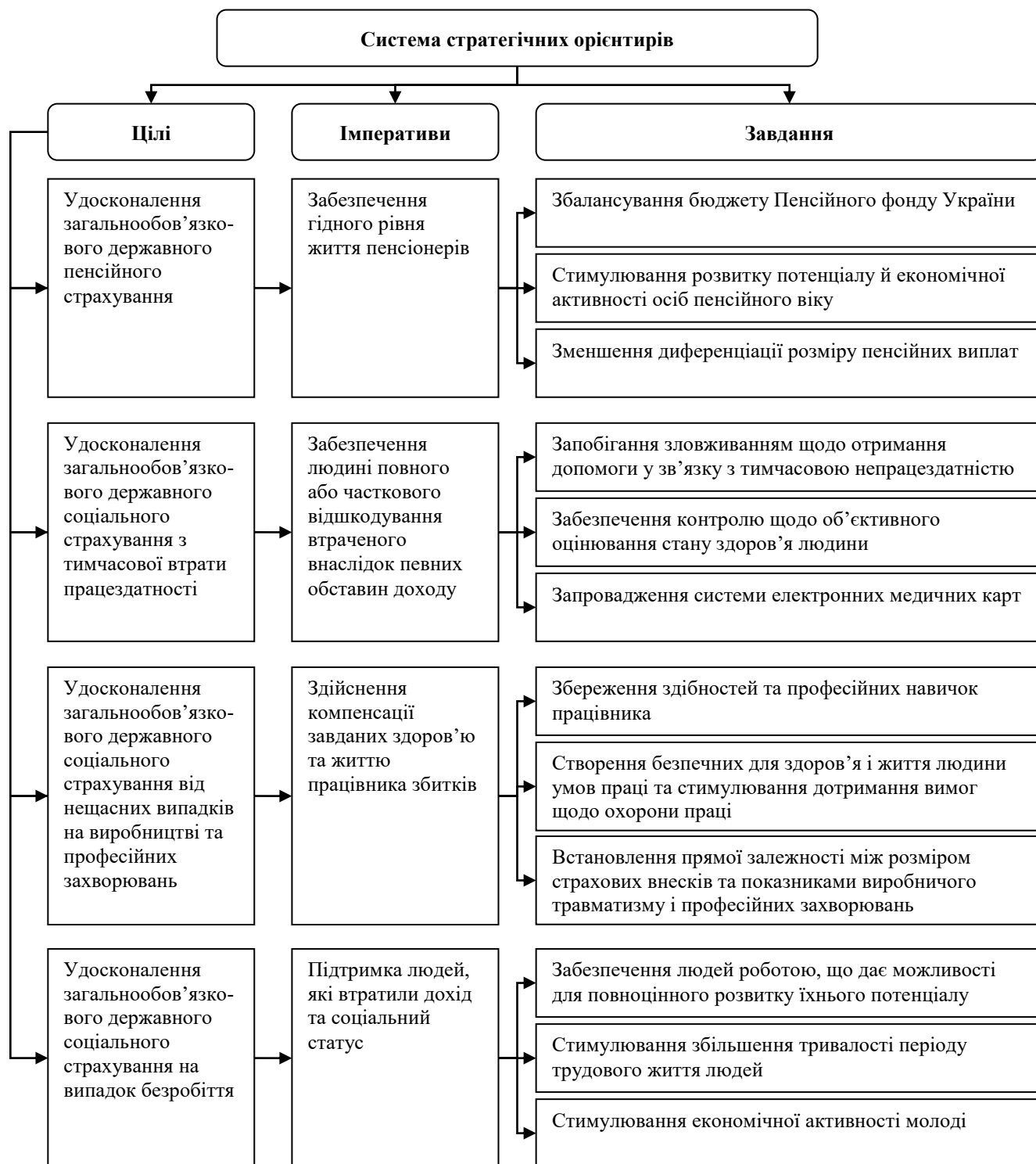
Рис. 7. Система стратегічних орієнтирів реформування фінансового забезпечення державних соціально-страхових фондів

Наведена система орієнтирів дає змогу ґрунтовно та системно вдосконалювати функціонування усіх видів загальнообов'язкового державного соціального страхування в Україні як інструмента впливу на умови відтворення і розвитку людського потенціалу.