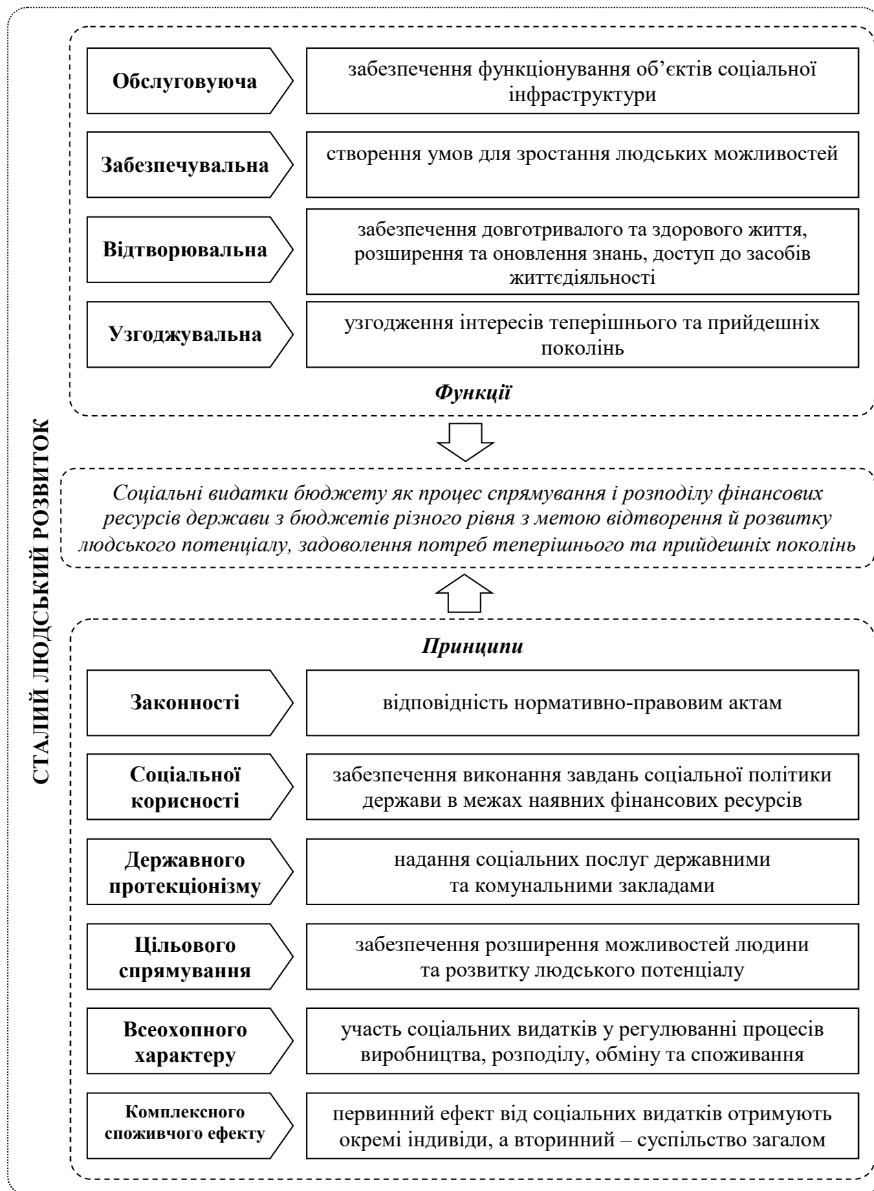
Рис. 3. Сутність, принципи та функціональне призначення соціальних видатків бюджету в умовах сталого людського розвитку

рівнях; сприяння фінансовій зацікавленості суб'єктів господарювання приватної форми власності у розвитку охорони здоров'я.