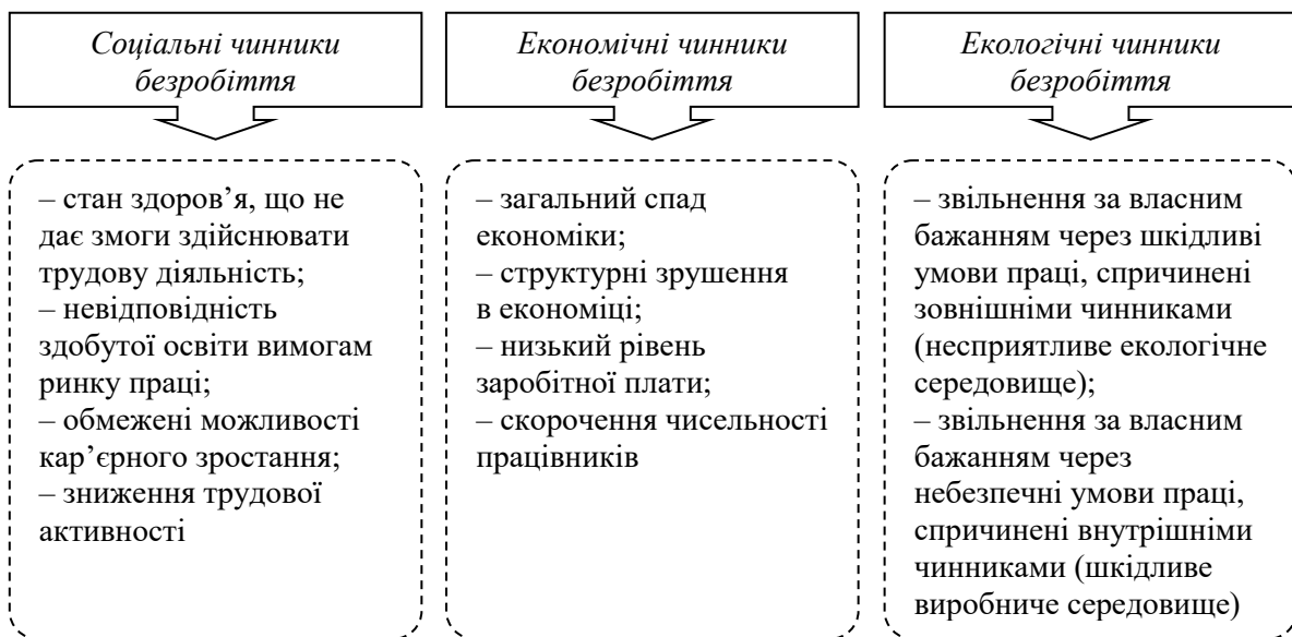
Рис. 5. Основні чинники формування безробіття

З'ясовано, що важливою умовою забезпечення зайнятості населення є формування системи соціального партнерства за участю: профспілок та організацій, що опікуються проблемами найманих працівників; працедавців, у тому числі керівництва державних підприємств і підприємців; органів місцевого самоврядування, котрі розробляють та реалізують політику зайнятості на відповідній території. Виділено три групи чинників формування безробіття: соціальні, економічні й екологічні (рис. 5).