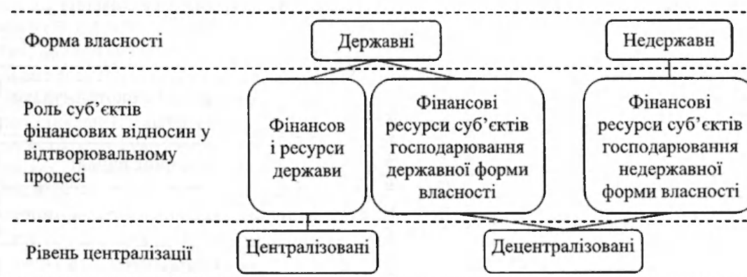
Рис 1. Класифікація фінансових ресурсів

Не дивлячись на загальні характерні ознаки фінансових ресурсів суспільства, порядок формування і використання централізованих і децентралізованих фінансових ресурсів має свої особливості.