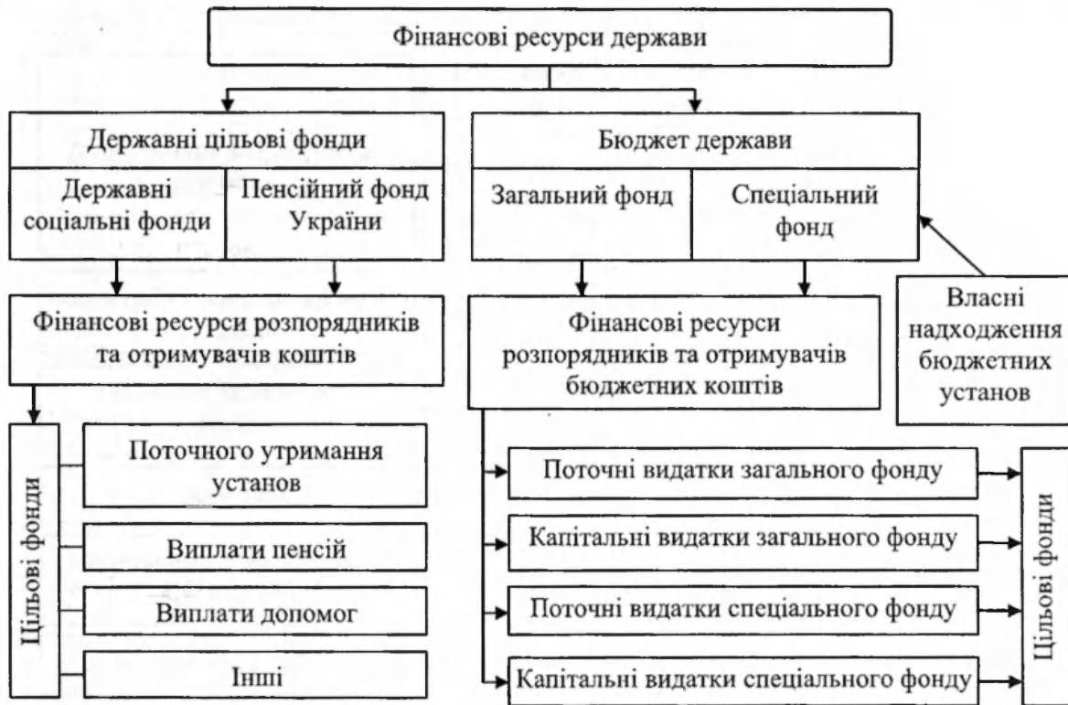
Рис. 3. Розподіл та використання фінансових ресурсів держави

Процес формування і використання фінансових ресурсів суб'єктів господарювання усіх форм власності відображений на рис. 4.