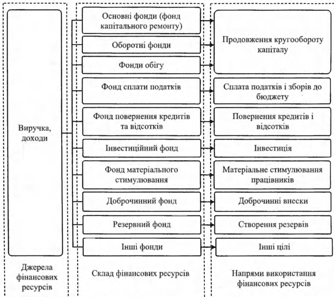
Рис. 4. Джерела, склад та напрями використання фінансових ресурсів підприємств

відносин для досягнення кінцевої мети, забезпечення виконання їхніх завдань, функцій, повноважень і зобов'язань. Це дасть можливість, з одного боку, акцентувати увагу на спільних ознаках фінансових ресурсів усіх суб'єктів фінансових відносин, а з іншого – виділити особливості формування і використання цих ресурсів у різних ланках фінансової системи, що матиме позитивний вплив на забезпечення єдності фінансової теорії та практики і сприятиме позитивним зрушенням у темпах соціально-економічного розвитку суспільства.