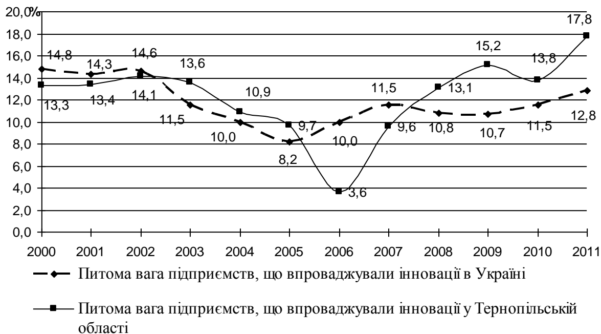
Рис. 2. Динаміка питомої ваги підприємств, що впроваджували інновації в Україні та Тернопільській області за 2000-2011рр.

Встановлено, що в Україні існує нормативно-правове поле, що визначає основи розвитку інноваційної, наукової та науково-технічної діяльності. Однак з кінця 90-х років як у країні в цілому, так і в Тернопільській області простежується тенденція зниження інноваційної активності підприємств (рис. 2.).