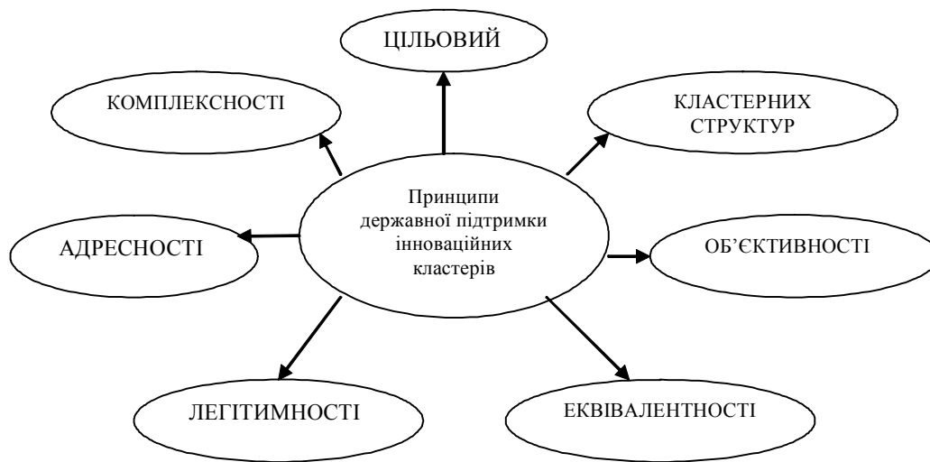
Рис. 2. Основні принципи державної підтримки інноваційних кластерів