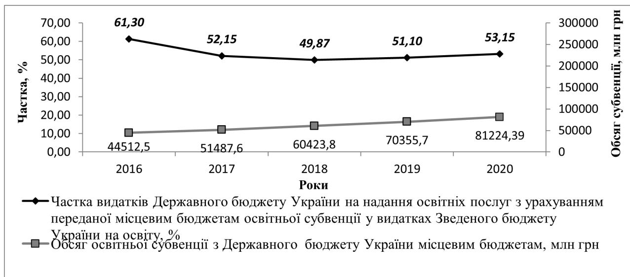
Рис. 2. Динаміка видатків Державного бюджету України на надання освітніх послуг з урахуванням освітньої субвенції, наданої місцевим бюджетам, у 2016–2020 рр.