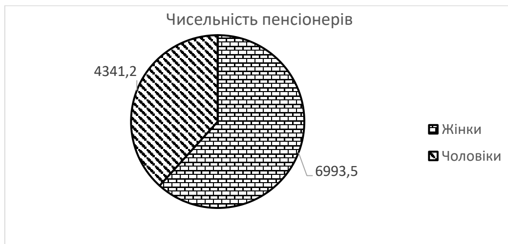
Рис. 2. Структура пенсіонерів відповідно до їх статі станом на 1 січня 2020 року, осіб

Із загальної чисельності пенсіонерів: 6 993,5 тис жінок (61,7%) та 4 341,2 тис. чоловіків (38,3%). Таким чином, жінки серед загальної кількості пенсіонерів складають понад дві третини. Це, загалом, пов'язано із довшою тривалістю життя жінок в цілому (рис. 2).