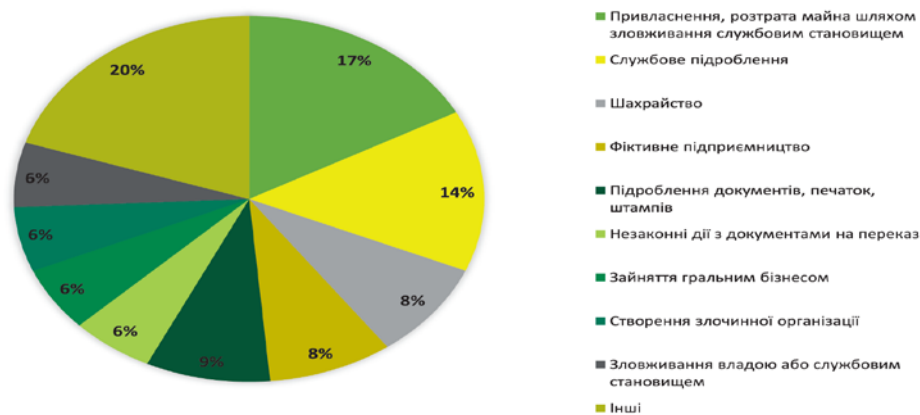
Рис. 2. Структура предикативних злочинів у кримінальних провадженнях за 2019 рік [4]

Ці злочини мають корупційні ознаки. Економічна злочинність на корупційній основі реально загрожує національній безпеці України, впливає практично на всі сфери суспільного життя – соціальну, правову, політичну. Корупція є передумовою і наслідком функціонування тіньової економіки держави, а суб'єкти корупційних діянь – одні з основних споживачів послуг з відмивання коштів, і водночас – неодмінні учасники більшості схем їхнього «відмивання». Саме тому без радикального зниження рівня корупції заходи щодо детінізації національної економіки, запобігання та протидії організованій злочинності не дадуть очікуваного ефекту. Спроби побороти корупцію лише за допомогою вибіркового покарання за корупційні діяння не будуть ефективними, оскільки залишаються глибинні чинники цих соціальних поведінкових деструкцій.