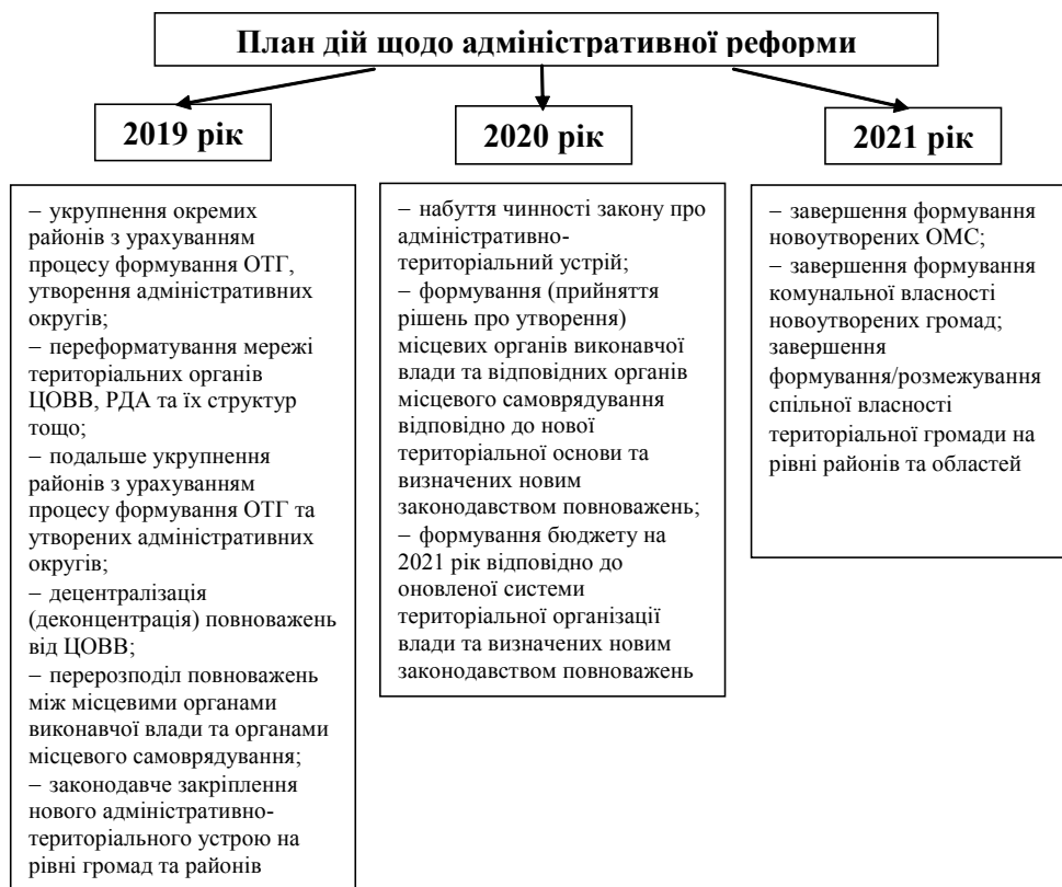
Рис. 2. План дій щодо реформи місцевого самоврядування