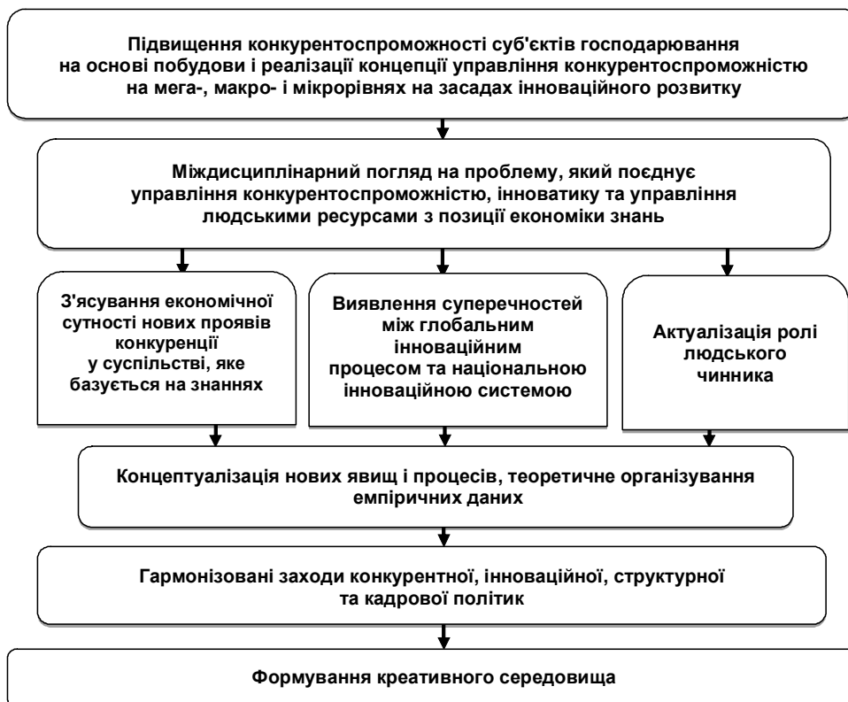
Рис. 1. Гіпотеза, що висувається для пояснення сутності управління конкурентоспроможністю суб'єктів господарювання

У такій динамічній ситуації, як зазначають експерти, найважливішими конкурентними перевагами успішних підприємств стають ефективні бізнес-процеси, кваліфікований менеджмент, персонал, інноваційний клімат та інноваційний розвиток, продуктивна бізнес-культура. Зазначені конкурентні переваги формуються як результат впровадження в практику господарювання управлінських інновацій.