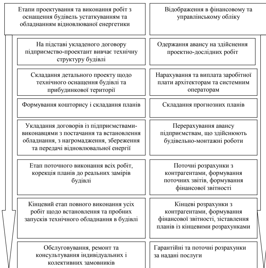
Рис. 2. Моделювання системи ведення обліку малими підприємствами відновлювальної енергії