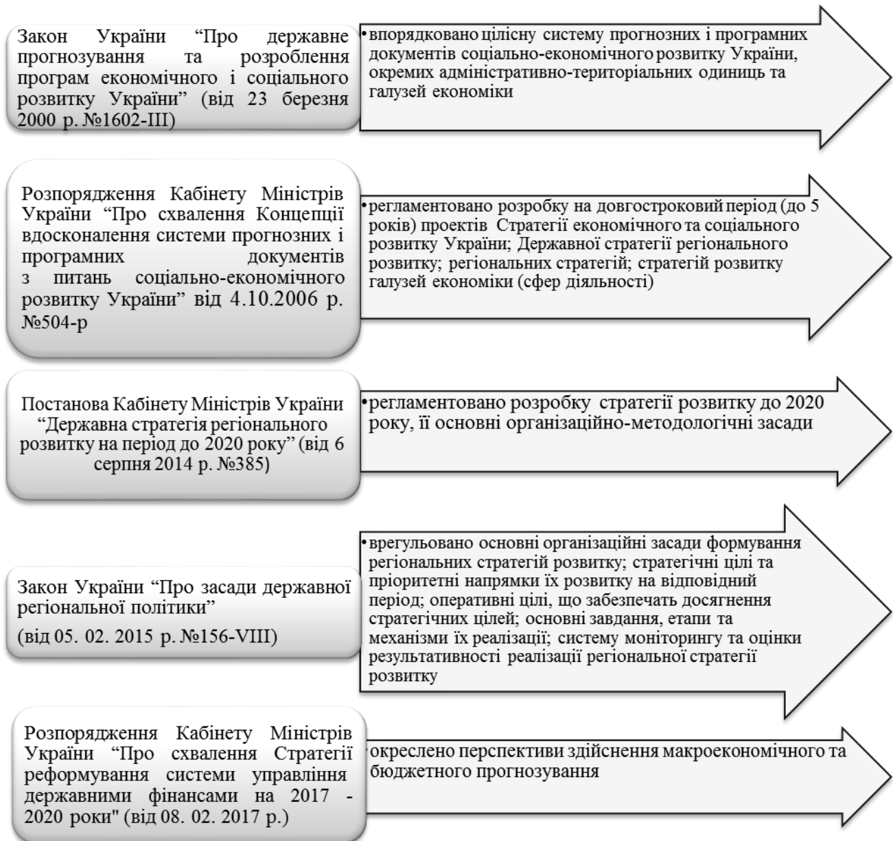
Рис. 1. Розвиток нормативно-правового забезпечення здійснення стратегічного планування*