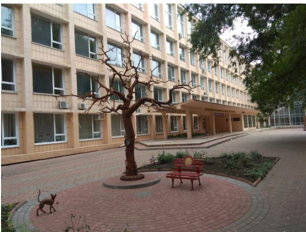
Рис. 1. Арт-об'єкт «Дерево пізнання». Автор – Вадим Колісник. Одеса, 2018

Одним з прикладів таких інсталяцій є арт-об'єкт, який у вересні 2018 року з'явився на території Одеського національного університету до 100-річного ювілею навчального закладу. Композиція називається «Дерево пізнання» (рис. 1). Автор – одеський художник, дизайнер Вадим Колісник.