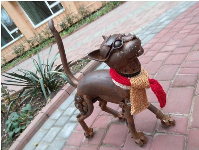
Рис. 2. Приклади вдягання Кота в арт-об'єкті «Древо пізнання», Одеса, (фото взяті з Facebook (І. Рязанова) та Google-maps).

Тобто, якщо на показах мод глядачам лише пропонуються нові моделі одягу, а глядачі цього шоу залишаються глядачами, то тут у глядачів є можливість самим зіграти «роль» модельєра, дизайнера або іміджмейкера.