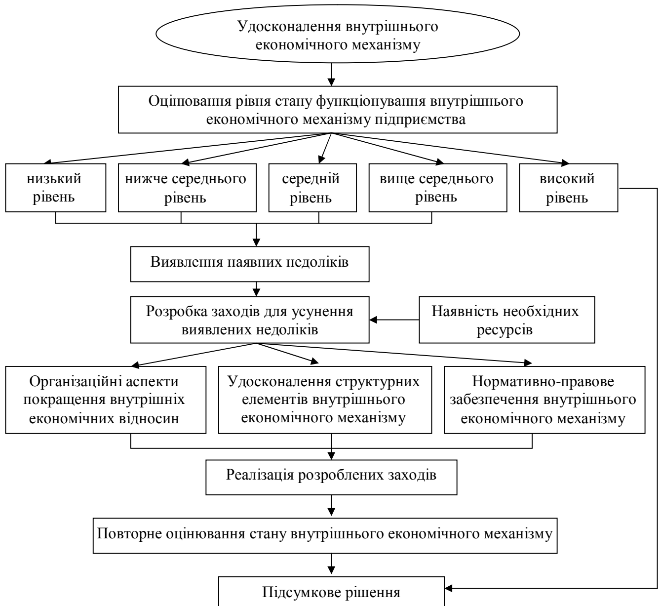
Рис. 3. Структурно-логічна модель удосконалення внутрішнього економічного механізму підприємства

логічно-послідовних етапів робіт, спрямованих на забезпечення більш ефективного функціонування цього механізму та покращення діяльності підприємства (рис. 3).