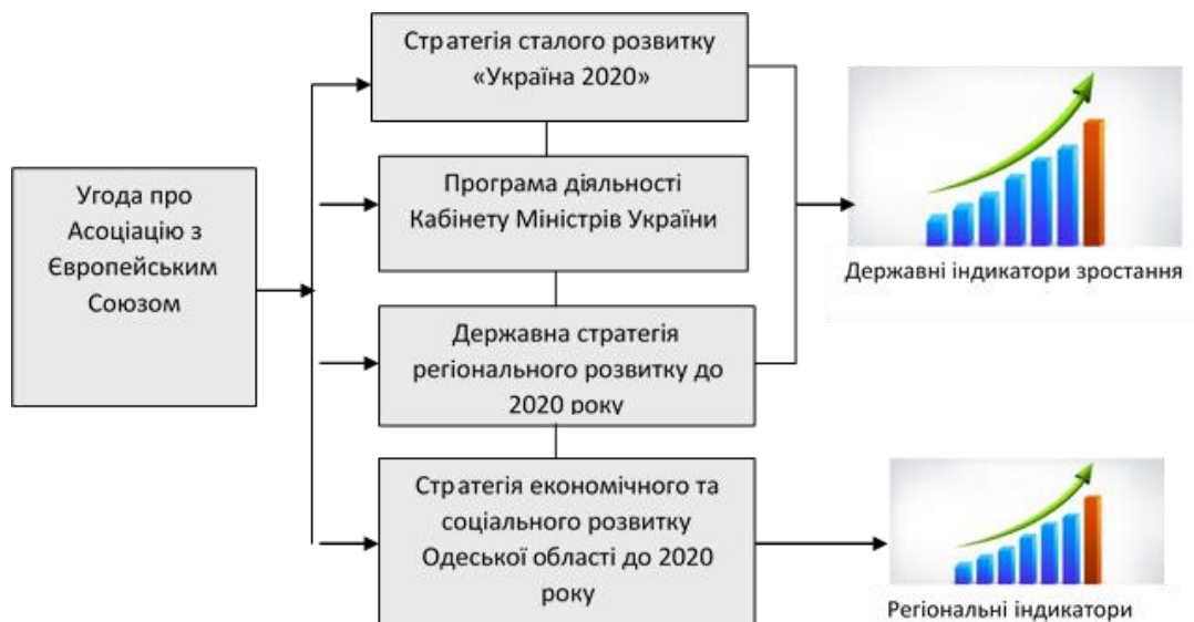
Рис. 2. Узгодження стратегії розвитку Причорноморського регіону з державною політикою