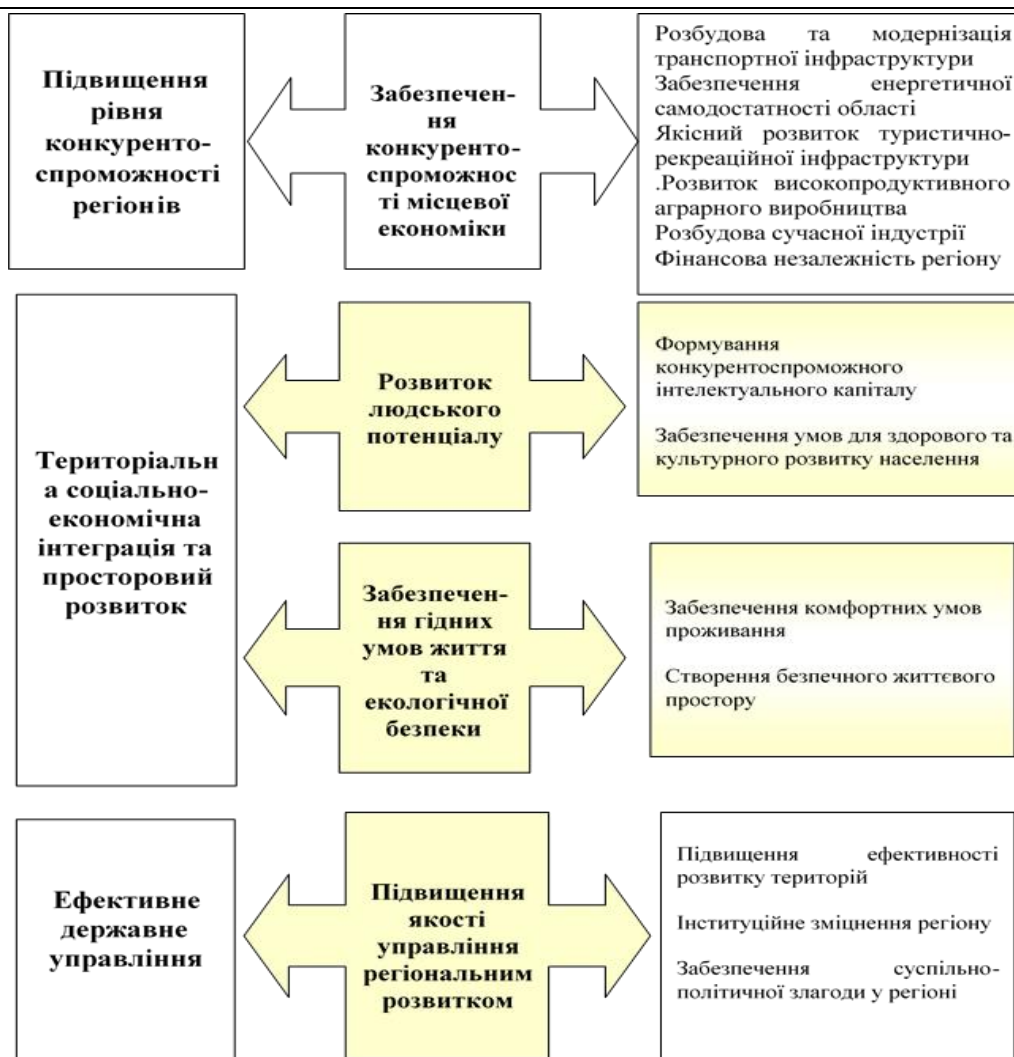
Рис. 3. Узгодженість різних аспектів трансформації фіскальної політики з державними та регіональними пріоритетами

Стратегічним завданням, пріоритетам і послідовності їх виконання бракує чіткої причинно-наслідкової взаємоузгодженості, а також системи механізмів та інструментів досягнення окреслених завдань, що створює потребу в окремих деталізуючих документах, до яких відносять середньо- і короткострокові загальнонаціональні програми діяльності урядів, річні плани заходів реалізації Державної стратегії, довгострокові стратегії розвитку регіонів і угоди щодо регіонального розвитку. Крім того, незважаючи на те, що всі українські регіони мають регіональні стратегії, вони затверджені у різний час, мають різний ступінь деталізації, відрізняються за структурою. Плани реалізації регіональних стратегій або відсутні взагалі, або мають характер документу, мало пов'язаного із самою стратегією. Параметри моніторингу виконання стратегій слабо корелюються із їх цілями або мають характер показників у гривнях, що є малопридатним інструментом для контролю через інфляційні процеси.