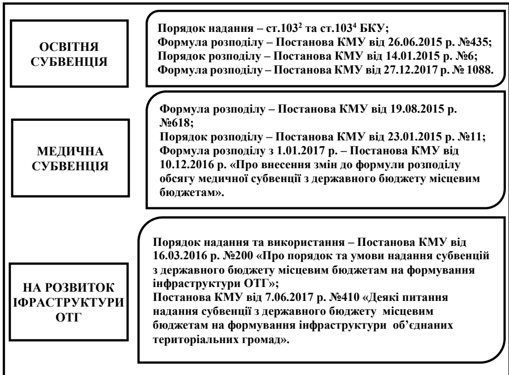
Рис. 4. Нормативно-правове забезпечення деяких видів субвенцій об'єднаних територіальних громад*