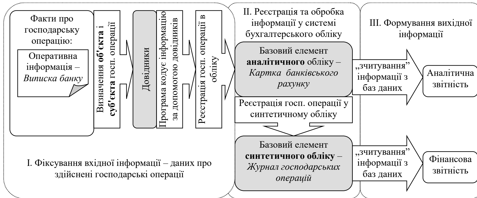
Рис. 1. Послідовність реєстрації господарських операцій у автоматизованій системі підприємства