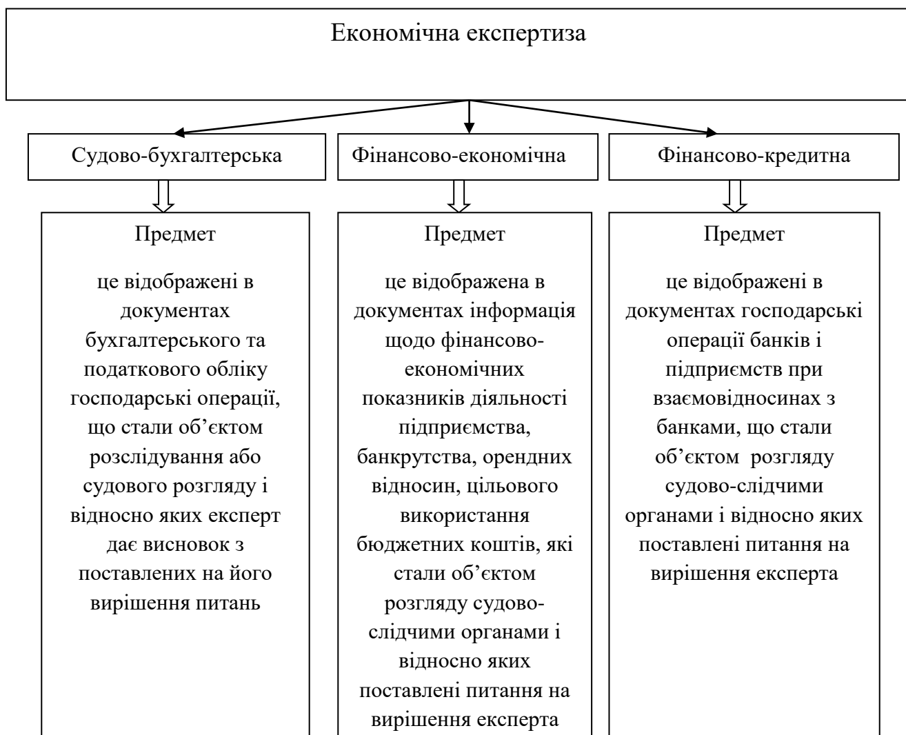
Рис.3. Предмет економічної експертизи

Фінансово-кредитна аналізує документи фінансово-кредитних операцій. Кожний напрям дослідження економічної експертизи має свій предмет та завдання (рис.3).