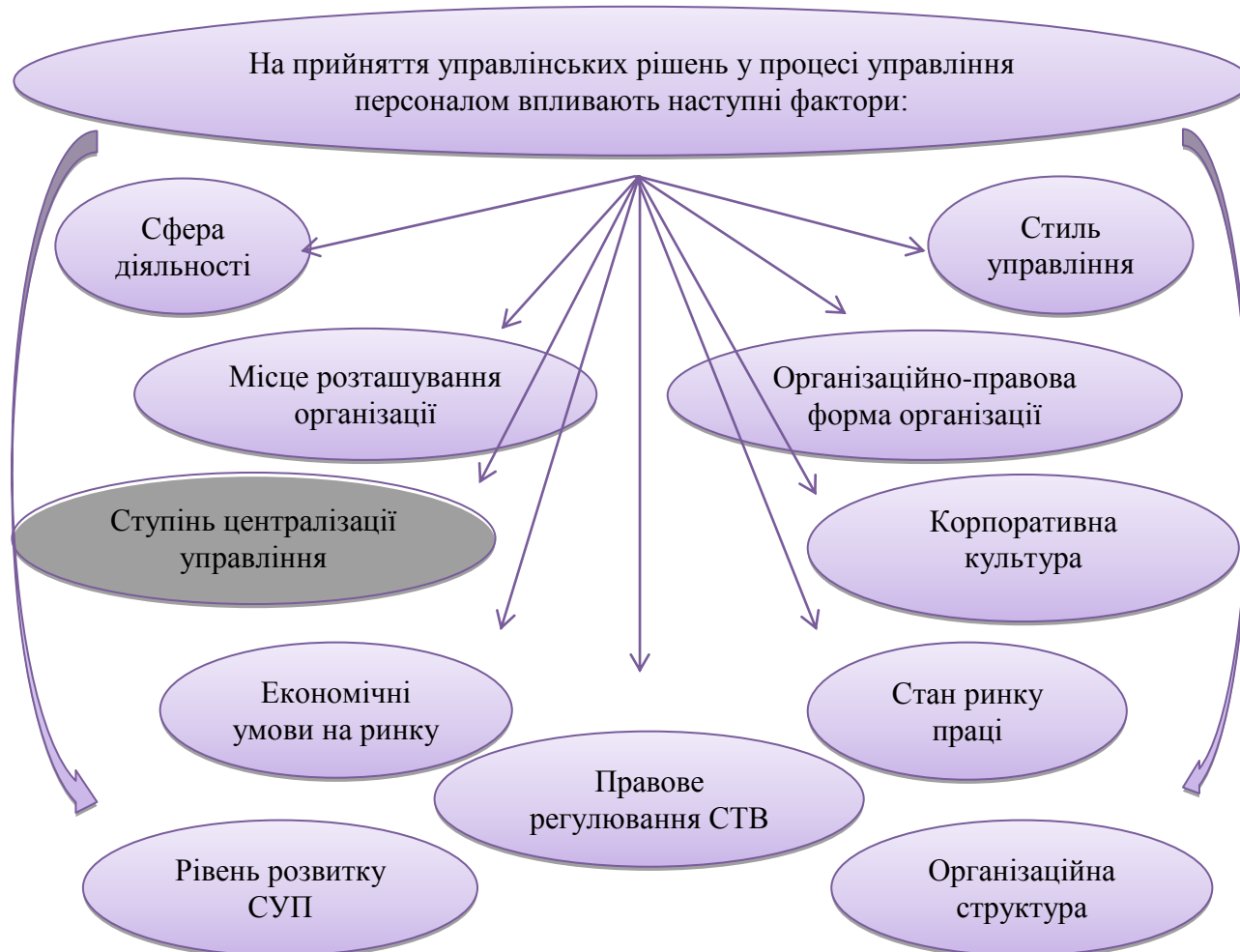
Рис. 2. Фактори, що впливають на кадрові рішення в організації.

Є певні чинники, які впливають на процес прийняття управлінських рішень в управлінні персоналом організації. Дані чинники відображені на рисунку 2.