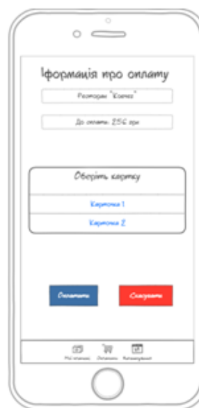
Рисунок 3 – Прототип вікна додатку для проведення операції оплати