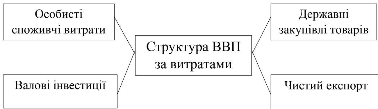
Рис.1.1 Структура ВВП за витратами

При розрахунку ВВП за витратами додаються витрати всіх економічних агентів, що використовують ВВП: домашніх господарств, фірм, держави і іноземців (рис. 2.1).