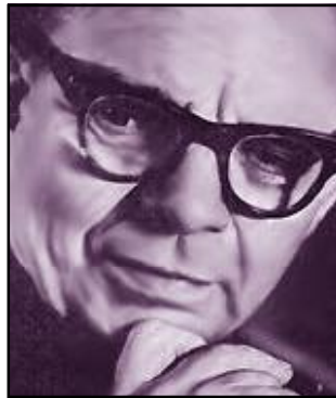
Костянтин ПЛАТОНОВ (1906–1985)

Костянтин Костянтинович Платонов (1906–1985) народився в Україні, у м. Харкові, в родині спадкоємних медиків, що визначило його інтерес до людини. Після закінчення в 1930 році Харківського медичного інституту працював лікарем. З 1932 року очолював дослідницький центр Нижньогородського автозаводу, а пізніше – Челябінського тракторного заводу. З часом займається проблемами підготовки військових кадрів, стає фундатором вітчизняної авіаційної психології. У роки Великої Вітчизняної війни очолює військово-лікарняну пілотну комісію Першого Білоруського фронту.