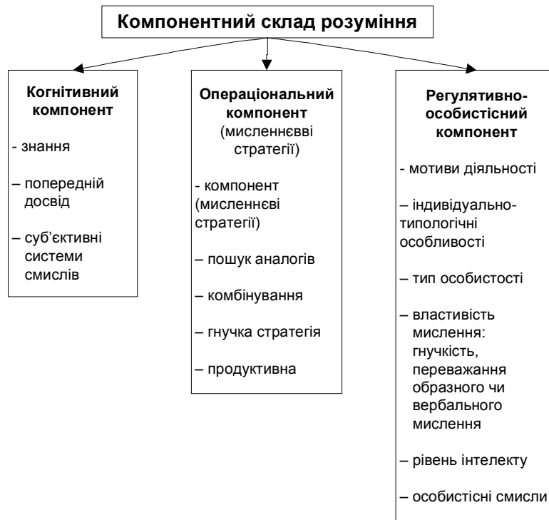
Рис. 1. Покомпонентна організація процесу розуміння

увагу на те, що окремими науковцями (Г.О. Балл, Г.С. Костюк О.М. Матюшкін, В.О. Моляко, Я.О. Пономарьов) детально проаналізовані підходи до трактування поняття “творча задача”. Узагальнений результат такий: процес розуміння творчих задач є моделлю творчої діяльності . Прийнятий нами психологічний погляд на природу творчої задачі полягає в обґрунтуванні її не тільки як навчальної заданості, а й як стану суб'єкта, якому потрібно зрозуміти щось нове, до цього часу невідоме. Такий погляд дає змогу моделювати за допомогою творчих задач будь-яку діяльність, котра ставить перед суб'єктом вимогу розуміння нової для нього інформації (остання при цьому розуміється в широкому змістовому контексті як певний набір знаків, поєднання яких утримує певний смисл).