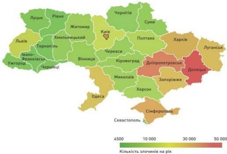
Рисунок № 2. Стан злочинності в Україні у 2012 році 2

Разом з тим у цей період відбувається абсолютне зменшення кількості злочинів проти життя та здоров'я (-9 989), злочинів проти статевої свободи та статевої недоторканості (-229), злочинів проти виборчих, трудових та інших особистих прав і свобод людини і громадянина (-4 867), злочинів у сфері господарської діяльності (-2 686), злочинів проти довілля (-299), злочинів проти безпеки виробництва (-373), злочинів проти громадського порядку та моральності (-1395), злочинів проти правосуддя (-1 630) [6, с.10].