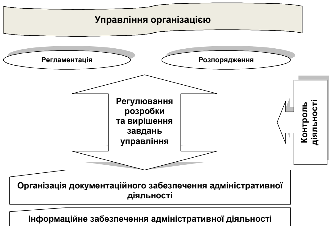
Рис. 2. Складові адміністративного менеджменту [7, с. 42]

Загалом основні завдання адміністративного менеджменту та його взаємозв'язок з управлінською системою можна подати так (рис. 2).