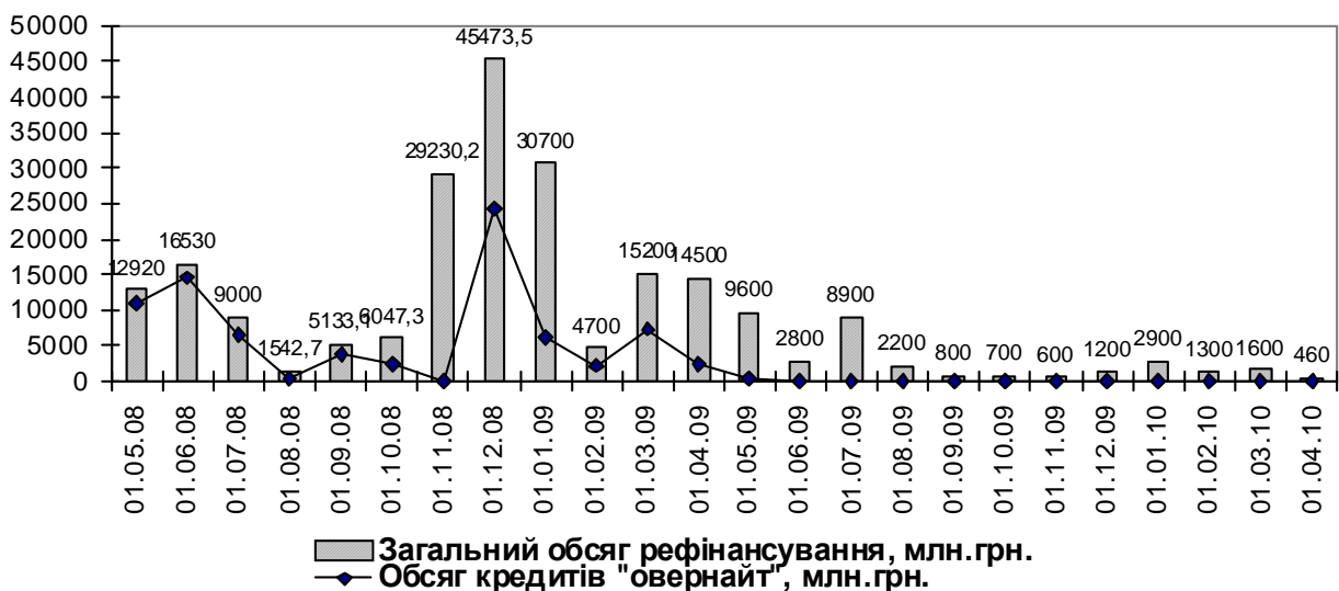
Рис. 1. Кредити, надані НБУ для підтримання ліквідності банків України за період 01. 05. 2008 – 01. 04. 2010 рр.

В умовах нестабільності на фінансовому ринку Національний банк застосовував гнучкі підходи щодо регулювання ліквідності банків, змінюючи спрямованість своїх операцій залежно від ситуації на грошово-кредитному ринку. [4, с. 7]. У другому півріччі 2008 та на початку 2009 рр. комерційні банки відчували проблеми із "миттєвою" ліквідністю, що відповідно зумовило зростання обсягів кредитів "овернайт" (рис. 1).