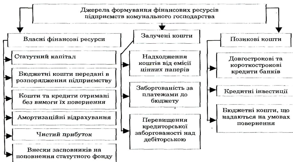
Рис 1. Основні джерела формування фінансових ресурсів підприємств сільського господарства.

ня фінансових ресурсів. Якщо в умовах централізованої системи управління фінансами основною метою діяльності підприємства було дотримання плану, то в умовах ринку економічну діяльність підприємства регулюють шляхом реалізації цінової, податкової, кредитної політики та інших економічних чинників [9, 15]. Специфіка діяльності підприємств, спрямованість на виконання найголовнішої функції – життєзабезпечення, отже, і постійна наявність регулятивної функції держави, виділяє підприємства галузі в окрему ланку суб'єктів господарювання. Такі умови функціонування підприємств сільського господарства суттєво обмежують розвиток фінансового менеджменту на підприємствах, безпосередньо впливаючи на структуру їхнього капіталу. Джерела формування фінансових ресурсів сільськогосподарських підприємств наведено на рис. 1.