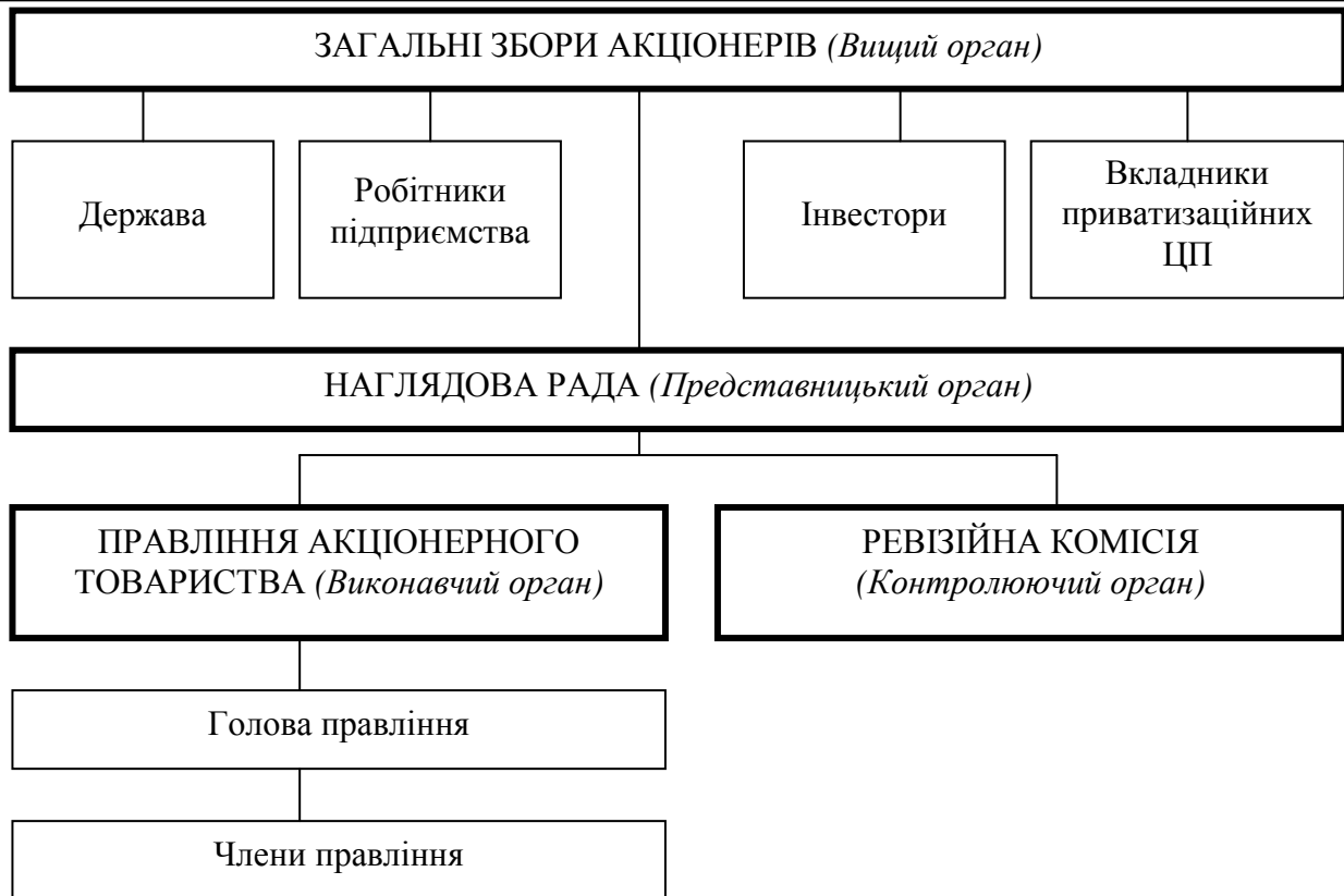
Рис. 2. Теоретична схема структури управління корпоративним підприємством (акціонерним товариством) в Україні.