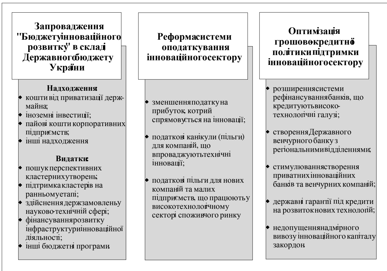
Рис. 2. Напрямки поліпшення бюджетно-податкової та грошово-кредитної політики підтримки інноваційної діяльності (Розробив автор).

Наразі його реалізують в обмеженій кількості регіонів (Головні пілотні регіони: Київська, Полтавська області, Автономна Республіка Крим; другорядні пілотні регіони: Харків, Донецьк), і специфічними завданнями цього проекту є: