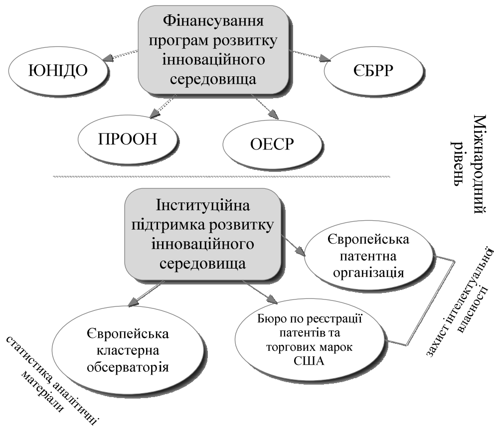
Рис. 3. Міжнародний рівень інноваційного середовища (Розробив автор).

нералізованої системи преференцій; продовжувати тісну співпрацю в рамках Діалогу між Європейською Комісією та Україною з питань захисту прав інтелектуальної власності. Для досягнення зазначеного потрібно стимулювати створення патентних підрозділів, підрозділів із питань трансферу технологій, інноваційної діяльності в державних органах влади і на підприємствах із державною формою власності, заохочувати суб'єктів господарювання до активного здійснення патентної експертизи інноваційних проектів у міжнародних патентних організаціях (зокрема, в Європейській патентній організації, Бюро з реєстрації патентів і торгових марок США) для мінімізації їх дублювань.