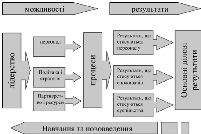
Рис. 1. Структура і критерії моделі досконалості EFQM

При розгляді методів підвищення якості питання людських ресурсів – найважливіше. Головна мета при впровадженні