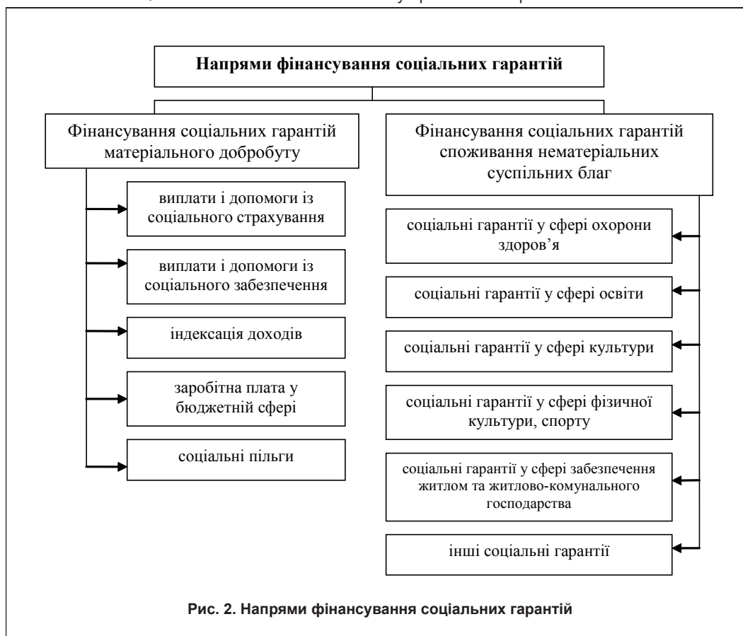
Рис. 2. Напрями фінансування соціальних гарантій

печення. Водночас, у державі повинні бути створені умови для споживання суспільних благ і послуг на рівні, вищому від гарантованого, а також якіснішого змісту.