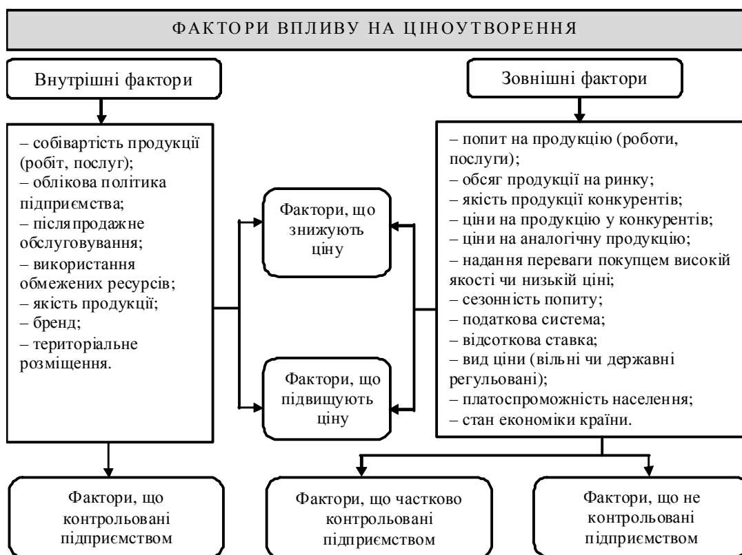
Рис. 1. Класифікація факторів, що впливають на ціноутворення в підприємствах

М. А. Окландер методи формування ціни поділяє залежно від напрямку орієнтації: на покупців чи на конкурентів. Методи з орієнтацією на покупців науковець поділяє на дві групи: а) методи на основі сприйняття цінності товару: розрахунку економічної цінності товару; оцінки максимально прийнятної ціни; б) метод з орієнтацією на попит. В другій групі методів з орієнтацією на конкурентів науковцем виділено: метод слідування за ринковими цінами; метод слідування за лідером [7, с. 70]. На наш погляд, такий поділ є обґрунтованим, оскільки він відображає прийнятну та оптимальну ціну не лише для продавця, а й для покупця, враховуючи економічну цінність товару.