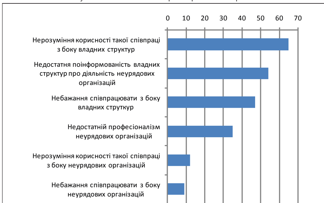
Рис. 3. Причини недостатньої співпраці між неурядовими організаціями та державними структурами на загальнодержавному, регіональному та місцевому рівнях *