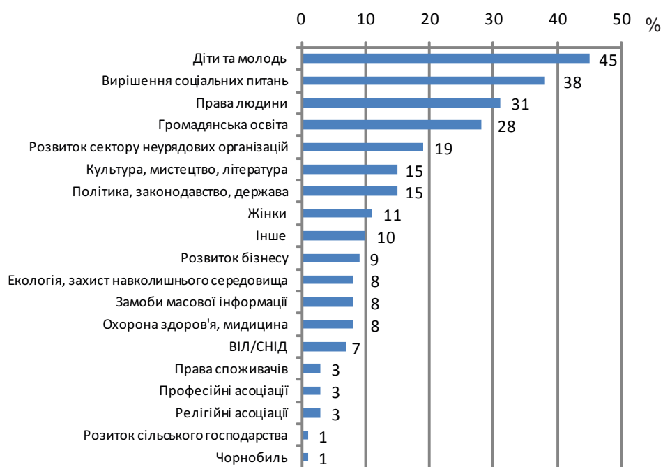
Рис. 2. Основні види діяльності неурядових організацій в Україні *

Аналіз суспільних проблем, вирішенням яких займаються неурядові організації, засвідчує, що представництво та захист прав належить до найпоширеніших видів діяльності, а 88% із них так чи інакше займаються адвокатуванням (представництвом та захистом прав і інтересів громадян та суспільних інтере-