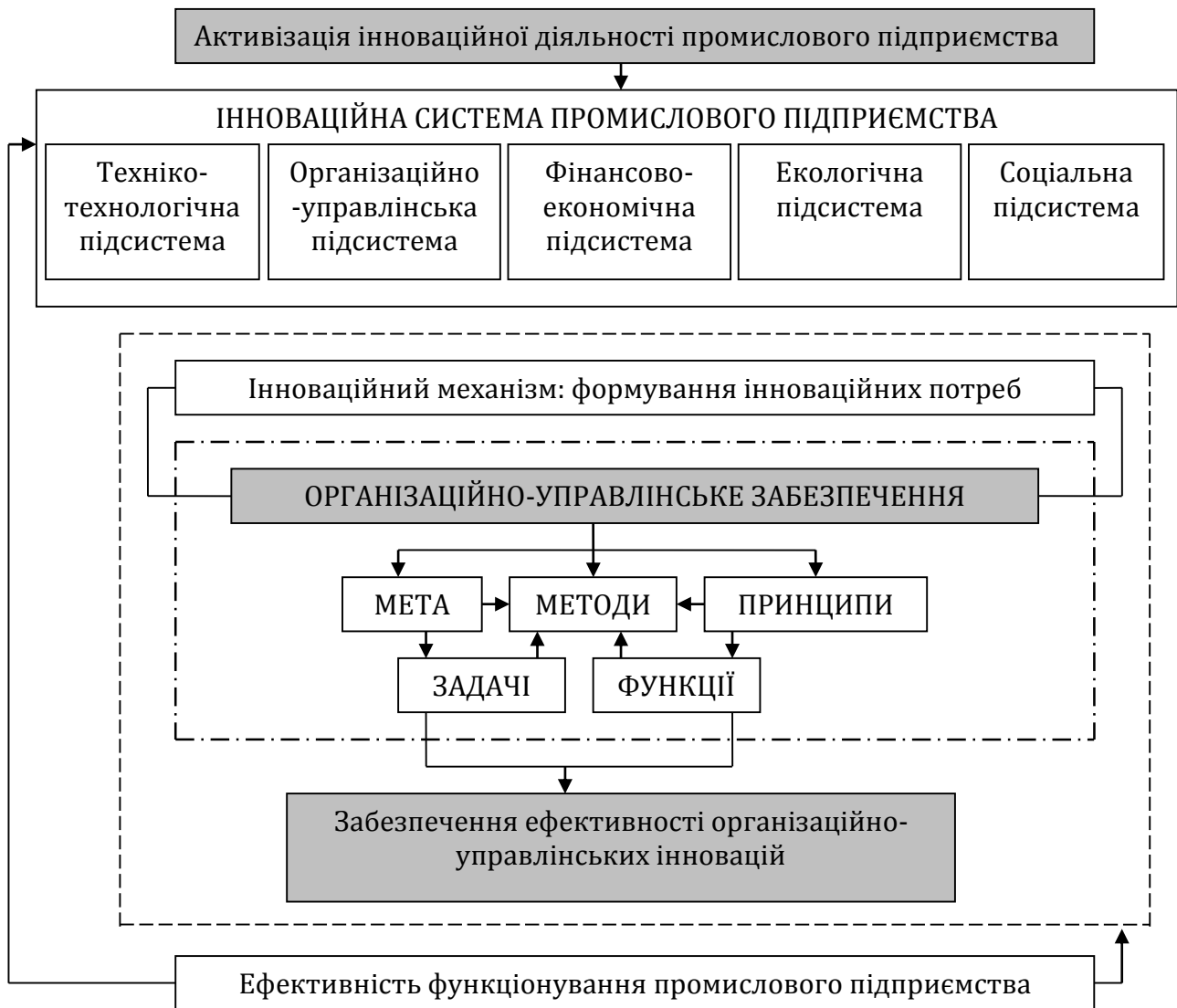
Рис. 1. Організаційно-управлінське забезпечення механізму активізації інноваційних процесів на промисловому підприємстві

Процес активізації інноваційної діяльності підприємства забезпечується низкою методів, показники яких також слугують проміжними показниками інноваційної діяльності. У організаційно-управлінській сфері це можуть бути організаційне проектування; бенчмаркінг; реінжиніринг бізнес-процесів; реструктуризація.