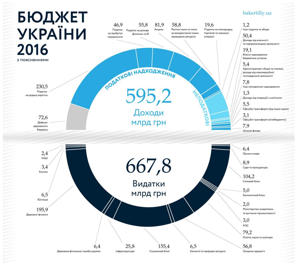
Рис. А.1. Структура державного бюджету 2016 року