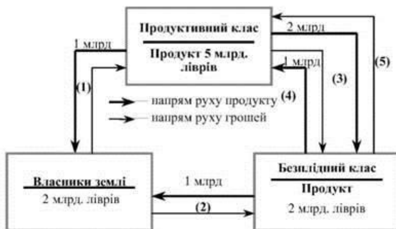
Рис. 1.1. Економічна модель Ф.Кене

В теорії економічного зростання варто виділити три загальні напрями: