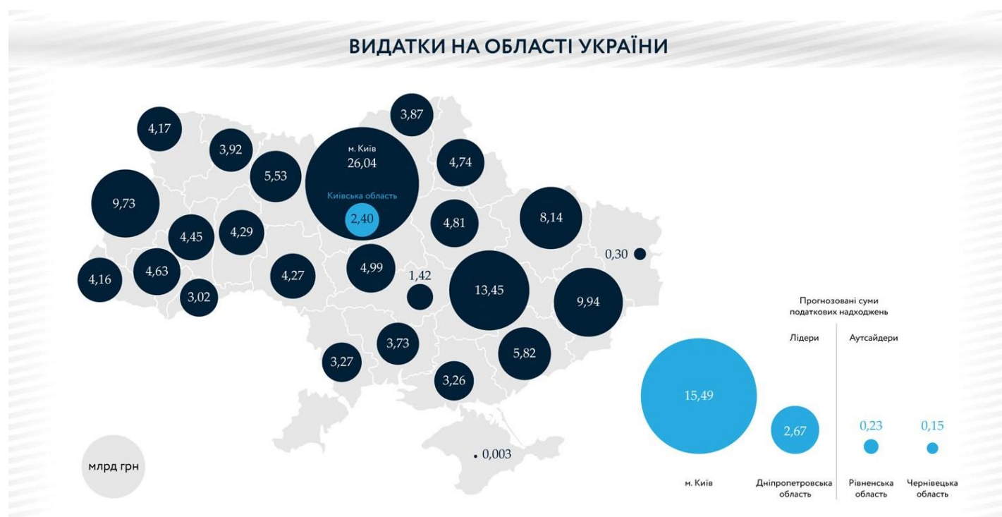
Рис.Б.1. Видатки на області України