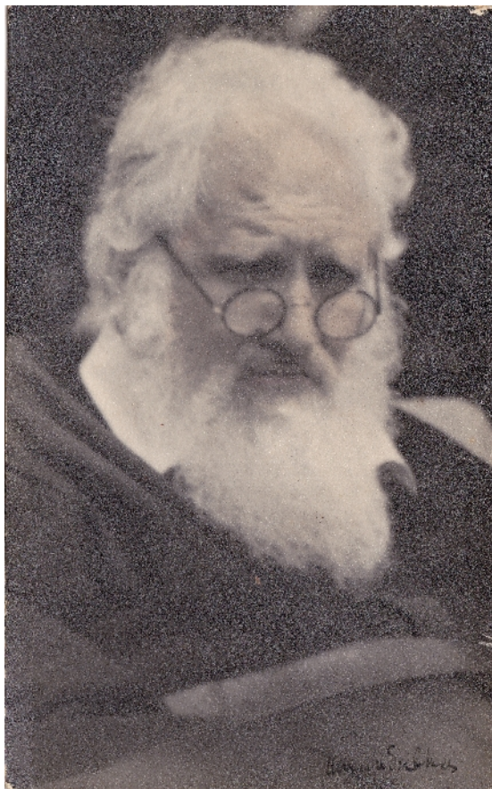
6: « » -