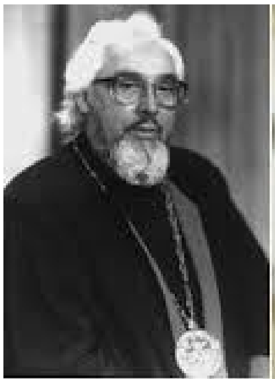
8: (1926 – 2004)