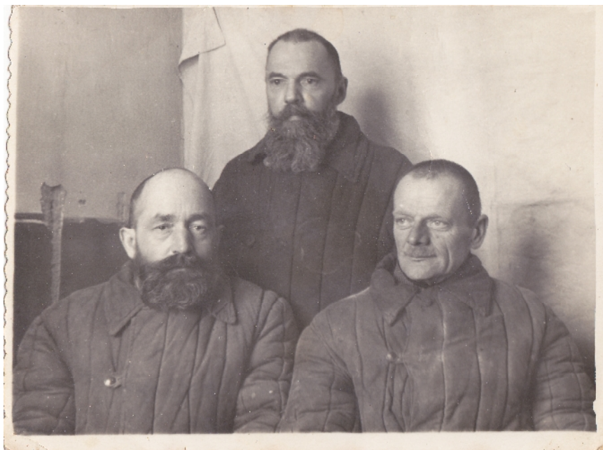
5: , . . . , . . . / , . . . , 1953 .