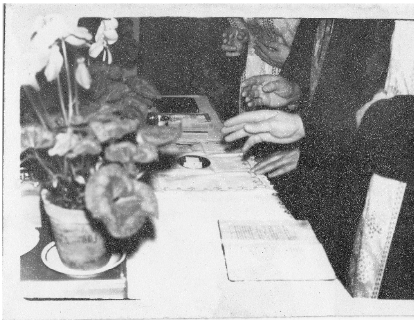
13: « . . . ».