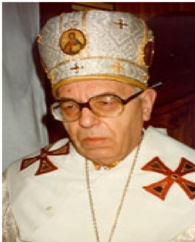
7: (1913 – 1995).