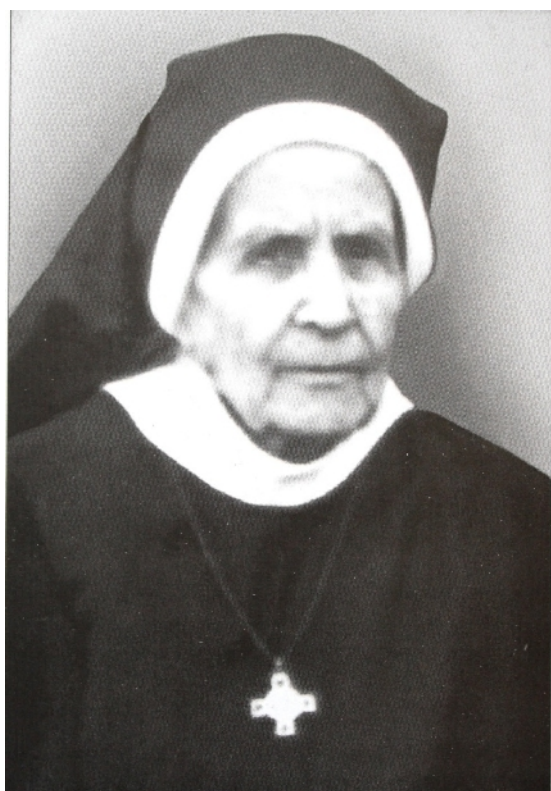
9: - (1905 – 1996)