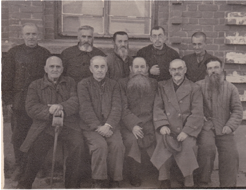
3: . . . 1- .