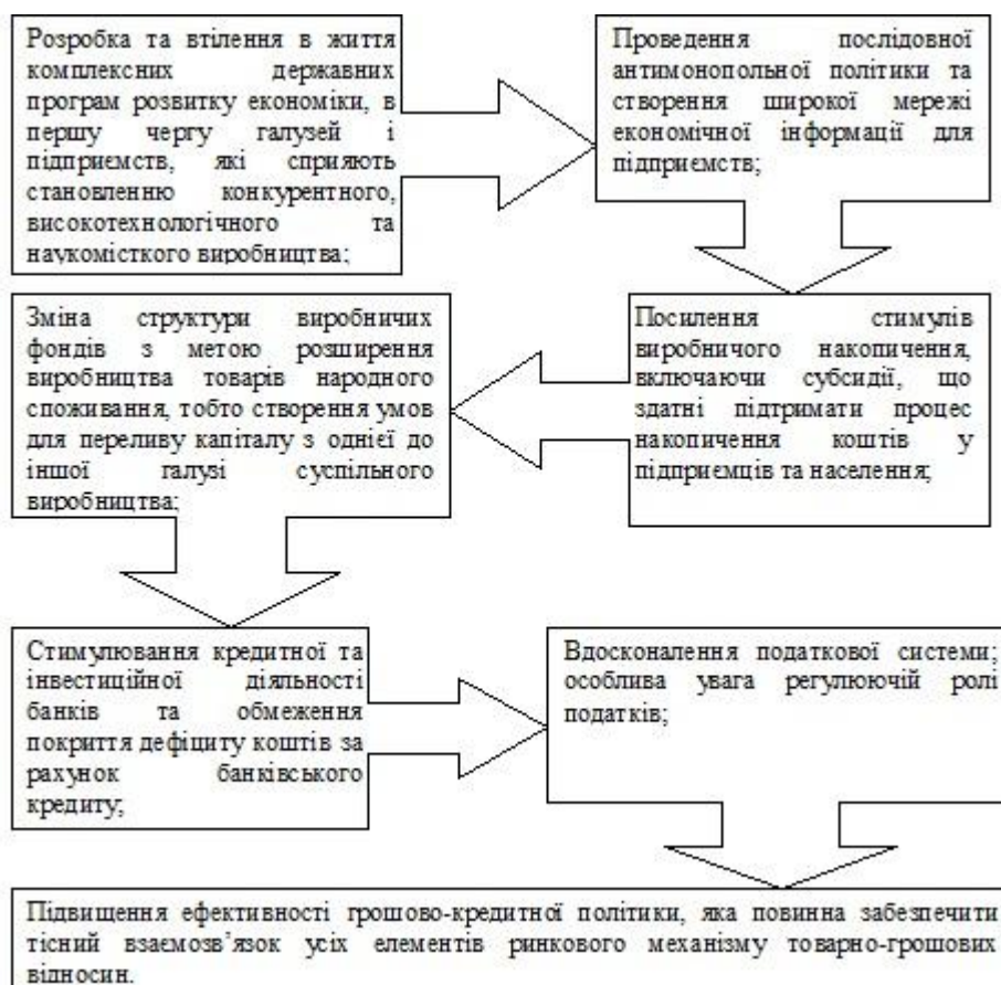
Рис. 3.1. Заходи антиінфляційного регулювання інфляції в Україні

Таким чином, з викладеного вище видно, що інфляція – це складний багатoproфільний процес, який впливає на ціноутворення та завдає серйозної шкоди економіці країни. Інфляція неодмінно призводить до кризи державних фінансів. Через неї реальна вартість доходів бюджету постійно зменшується, тому державі доводиться зменшувати свої витрати.