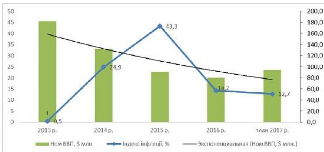
Рис. Б.1 Номінальний ВВП, індекс інфляції %, 2013-2016 рр.