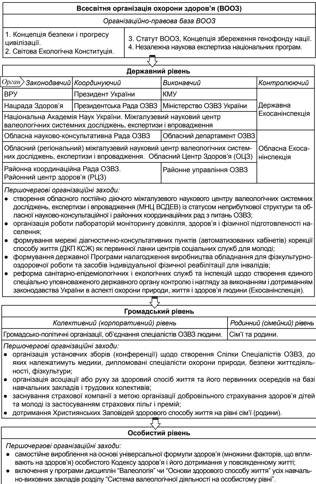
Рис. 2. Структурно-логічна схема формування превентивної системи ОЗВЗ