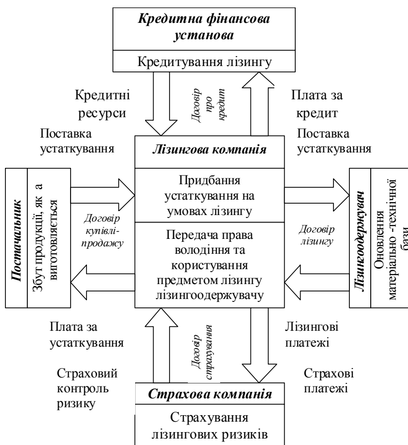
Рис. 1. Класична схема здійснення лізингової угоди

Сукупно перераховані особливості розкривають ефект лізингу як своєрідного економічного мультиплікатора, який надає імпульс розвитку всім ланкам підприємницької діяльності. Якщо перша особливість відображає динаміку ефекту лізингу, механізм його реалізації, а друга розкриває економічну сутність ефекту як виявлення нових емерджентних якостей лізингової форми підприємництва, то третя показує його соціальну спрямованість і тісний зв'язок із задоволенням особистих, колективних і суспільних інтересів. При цьому лізингову діяльність можна вважати ефективною: з точки зору особистих інтересів – якщо вона покращує можливості задоволення матеріальних і духовних потреб підприємців; з позиції колективних інтересів організації – якщо забезпечує умови для розширеного відтворення; з точки зору суспільства – якщо ринок насичується необхідними товарами і від збільшення масштабів виробництва товарів зростають надходження до бюджету [3, с. 127].